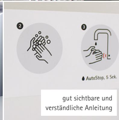
gut sichtbare und verständliche Anleitung