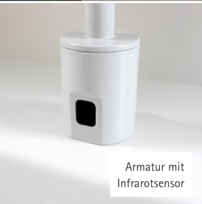
Armatür mit Infrarotsensor