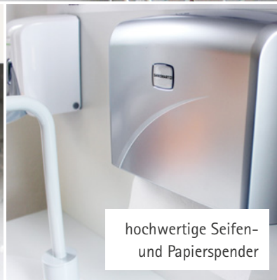
hochwertige Seifen- und Papierspender