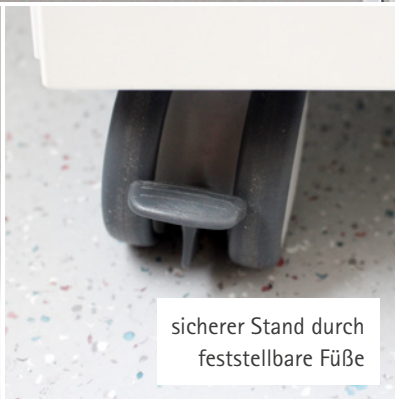
sicherer Stand durch feststellbare FüÙe